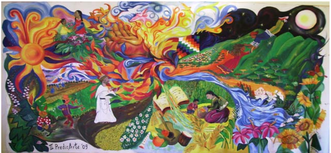
Mural pintado por participantes en el taller de artistas "Predicarte" San Pedro de Colalao, Argentina Tema: "Sto. Domingo, predicador de la Gracia"